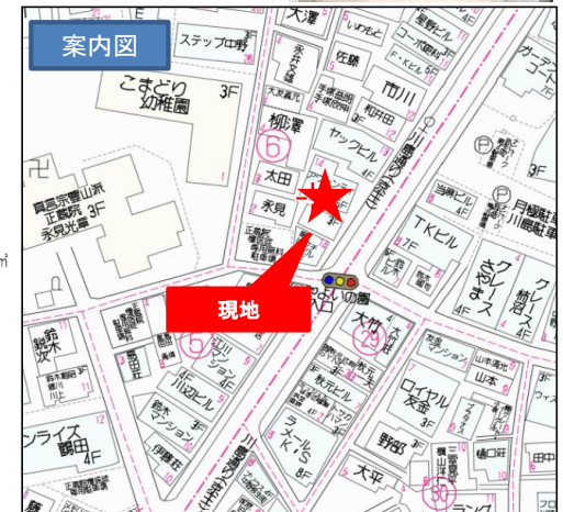
図面と現況が異なる場合は現況を優先とさせていただきます